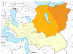
mit Mut zu drei Bezirken!

Die Grünliberalen teilen die in der Studie gemachten Schlussfolgerungen weitgehend, auch im Bezug auf die vorgeschlagene Aufgabenzuordnung. Welche Aufgaben jeweils am besten dem Kanton, den drei Bezirken oder den neu gegliederten Gemeinden übertragen werden sollen, bedarf einer tieferen Analyse auf Grund der zukünftigen Bezirks- und Gemeindegrössen.